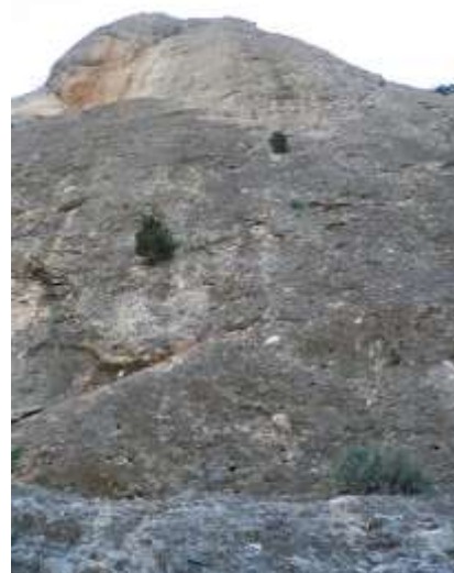
Pie de vía

El primer spit está algo debajo y a la derecha de una sabina que está creciendo en la pared.