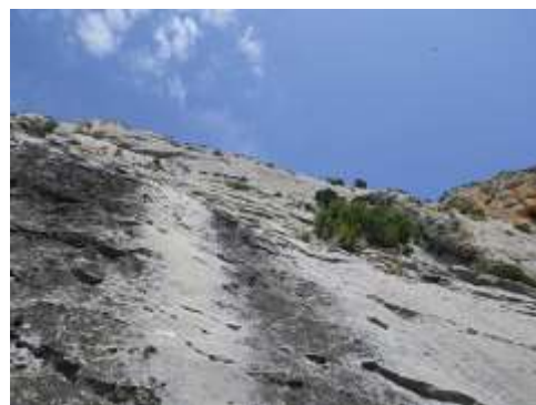
Inicio de la segunda parte (Feixa dels Espàrrecs)