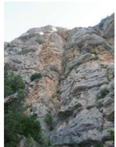
Pie de vía

La aproximación se inicia por la pista, al inicio de la cual nos encontraremos una cadena impidiendo el paso con un vehículo. Más adelante, en la misma curva que la pista gira hacia la derecha veremos unos hitos: Marca el inicio del sendero hacia la pared de Aragón. Nos iremos encontrando hitos que nos llevan directos hacia la pared. Ojo que no hay que subir hasta tocar la pared, sino que, a una cierta distancia, hay que ir hacia la derecha. Más adelante ya reseguiremos la pared. Bastante antes (unos 500m, 20 min) está la vía Santiago Domingo (pie de vía LSD). Iremos