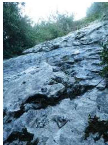
Pie de vía

En pueblo de Villalangua dejamos el coche en la zona indicada como aparcamiento . Desde ahí volvemos hacia atrás por la calle principal y pasada la fuente nos metemos hacia la derecha. Veremos unas indicaciones de Sendero temático, Salinas Viejo Agüero. Descendemos hacia el río, lo cruzamos y reseguimos la pista. En una bifurcación junto a una construcción, tomar la opción de la derecha y después seguir las indicaciones de Agüero. Hay un momento que nos encontramos un puente de piedra que toca cruzarlo. Más adelante nos encontramos una señalización donde una de ellas pone Salinas Nuevo que es la que hemos de tomar. A unos 5 metros de la señalización nos encontramos el desvío hacia la derecha para irnos hacia la pared. Pasaremos un tramo boscoso cerrado y acabaremos en una