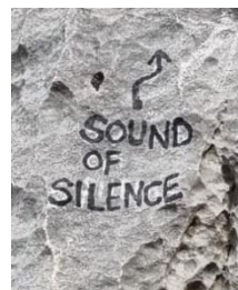
Pie de vía

derecha con una piedra junto a un árbol y un hito detrás. Ojo que otros desvíos antes pueden despistar. La pared no se ve desde lejos por el bosque. Cuandos lleguemos a la pared ir con tendencia hacia la izquierda y buscar el nombre a pie de vía..