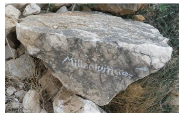
Piedra Millenium Cave

Para el aparcamiento poner en Google 7JRR+78 Dorgali . Nos enviará a una curva cerrada donde acaba la carretera SC Cala Gonone y empieza la vía Codula e' Gostui. De dicha curva sale una pista no asfaltada donde, al inicio, se puede dejar el coche.