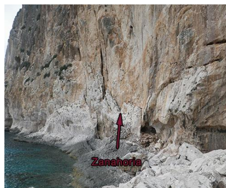
Pie de vía

encontraremos una cuerda fija que nos llevará prácticamente hasta la parte inferior del acantilado y muy cerca de la vía. Veremos una cueva en la parte inferior y de color más anaranjado. Justo al lado, fuera de la cueva, hay una parte más blanca y gris de conglomerado que es por donde empieza la vía. El primer químico se ve bastante alto y está justo cuando se haya superado el tramo más fácil del inicio. Básicamente lo que hemos indicado como primer largo.