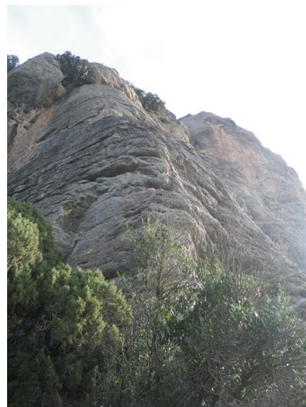
Pie de vía

La vía empieza por un espolón, a su izquierda habrá un diedro muy marcado. En el pie de vía hay un árbol con un trozo de cuerda atada a una de sus ramas y habrá que usarlo para poder llegar al primer seguro. La roca está desplomaba en los primeros pasos y hay que hacer uso del árbol.