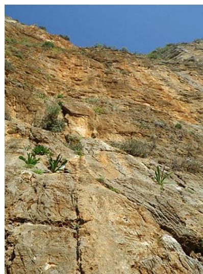
Pie de vía

el edificio. Desde ahí, junto a una piedra con una chapa cuadrada de color rojo y borde blanco, parte un sendero marcado que va hacia el sector Hospital. En la pared nos hemos de fijar que hay dos franjas rojas separadas por una columna gris que va desde la base hasta la cima. Nos interesa la franja roja más alejada de nosotros. La vía se encuentra en la parte más derecha de la franja roja.