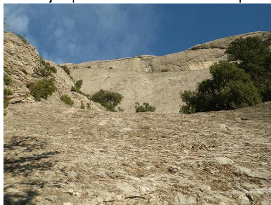
A pie de L0

La aproximación está prácticamente a la misma distancia desde la Vinya Nova. Hay opción de dejar el vehículo ahí.