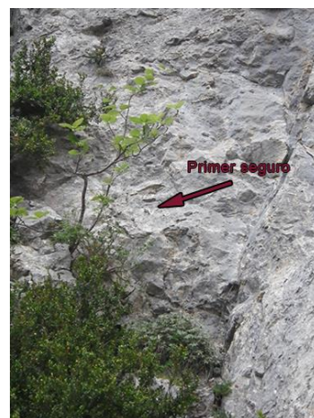
Inicio de vía

El inicio de vía es un diedro/canal herboso donde el primer parabolts se encuentra donde empieza la verticalidad junto a un árbol pequeño.