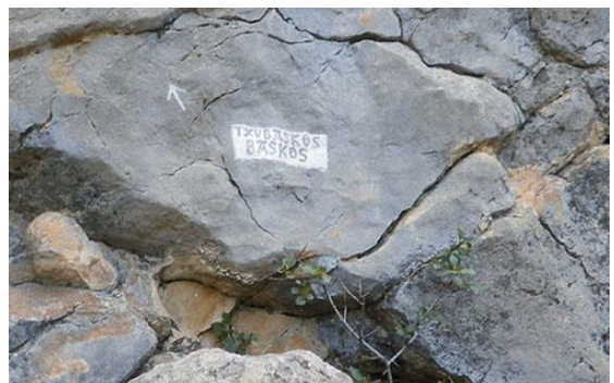
Pie de vía con el nombre

uno más arriba a la izquierda y el otro a la derecha. El nuestro es a la derecha bastante marcado. Inicialmente nos podemos guiar por un contrafuerte en forma de triángulo. La vía está pasado dicho contrafuerte. Tiene el nombre marcado a pie de vía.