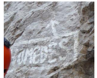
Pie de vía

A pie de vía está escrito el nombre de la vía, hay un parabolts y una flecha que despista ya que parece que apunte hacia la izquierda y la vía va hacia la derecha.