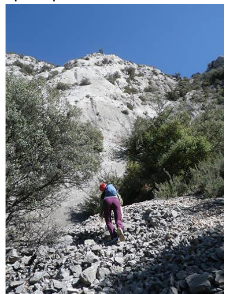
Llegando a la vía desconocida