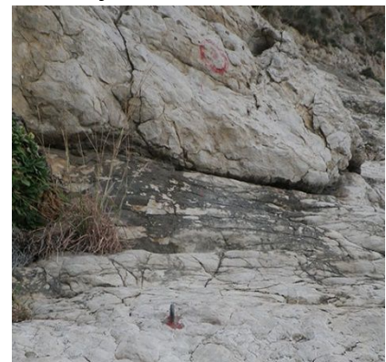
Pie de vía (circulo rojo algo borroso arriba al centro-derecho)

Descendemos la escalera y reseguiremos el camino bajando dos marmitas con cuerda fija. Nos encontraremos unas flechas indicativas y tomaremos la dirección de Cova del Testos, camino por el cual nos encontraremos un cable forrado para ascender hacia la cueva. Cuando demos la vuelta al espolón tenemos que estar atentos ya que veremos unos círculos rojos con un punto rojo concéntrico. Dichos puntos nos llevarán al pie de vía. En el mismo pie de vía tendremos uno de estos puntos y un químico donde la roca se ha pintado con el mismo color.