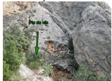
Pie de vía

tomando como referencia el diedro marcado de la vía vecina (Diedre del Pou). En la base de la pared encontraremos un antiguo pozo de una mina; a su izquierda, algo más elevado, estará el pie de vía con la R0 escondida detrás de unos arbustos.