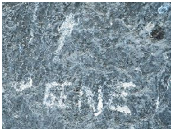
Pie de vía

Para ir al aparcamiento del Cabeço d'Or hay que desviarse dirección Cuevas del Canelobre cuando estemos conduciendo por la CV-774 entre Xixona y Busot. El desvío está a unos 4km de Busot. Al cabo de 2,3km de iniciarse el desvío llegaremos al aparcamiento. Desde ahí, mirando a la pared hay una pista que sale hacia la izquierda por la cual está prohibido circular. Es el inicio de la aproximación andando. Dicha pista la recorreremos durante unos 20 minutos hasta llegar a una casa con un jardín curioso pegada a la pista. En ese punto tendríamos que ser capaces de localizar la vía en la pared. Veremos un camino marcado que asciende dirección pared. Hay bastantes caminos que ascienden, por lo que en el pie de vía buscaremos el nombre GENE grabado en la roca.