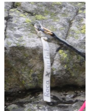
Cinta en la primera chapa

de cruzar por segunda vez la tubería, tendremos un sendero que se desvía hacia la derecha. Tomamos ese desvío. Al cabo de poco la pared y la vía serán claramente visibles. Tendremos que cruzar la tartera de bloques gigantes marcados con hitos para llegar hasta pie de pared. La vía empieza por el contrafuerte inferior. En la primera chapa hay una cinta colgando con el nombre de la vía.