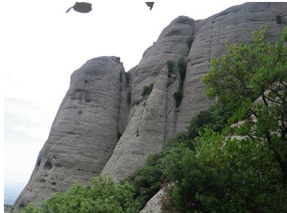
Puntal visto desde el lateral a la altura del desvío

Dejamos el coche por la zona del monasterio. Si alguien desea realizar la subida andando, puede consultar la entrada de la Aresta Ribas . Si tomamos el funicular, seguiremos el Camí Nou de Sant Jeroni unos 35 minutos. Hay un desvío poco marcado a mano izquierda, pasado el Cigronet, desde donde veremos el lateral del