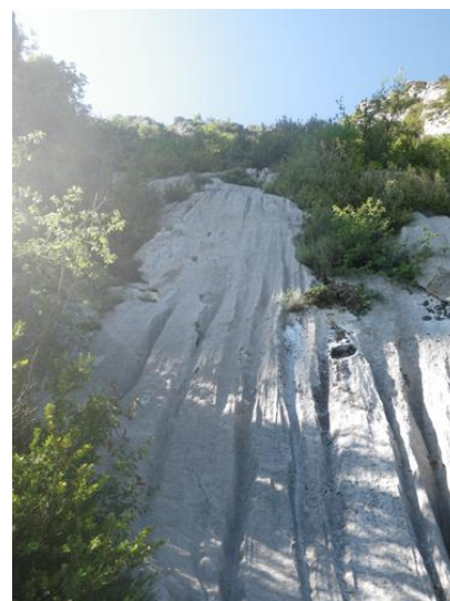
Pie de vía

adentrará en el bosque. El camino está bastante marcado. En el desvío nos vamos hacia la derecha y recorremos el hilo alámbrico que se suele poner como valla para delimitar el espacio de las vacas. Hay un nuevo desvío donde se puede 'abrir' el hilo, cruzamos y el sendero nos llevará a una tartera por la cual ascendemos hasta llegar a la pared. Seguimos hacia la derecha hasta ver una placa corta tumbada con unos canalillos marcados y químicos como seguros, es donde empieza la vía.