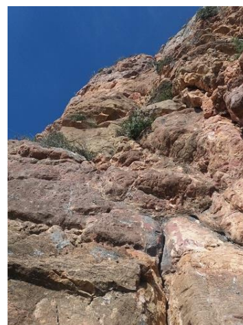
Pie de vía

desvío y siguiendo rectos, la siguiente curva cerrada será la del aparcamiento. Desde el aparcamiento seguiremos la carretera unos 15 minutos y llegaremos al tramo de pared que corresponde a la Pala Alta. Cuando tengamos identificada la vía ya veremos cerca un hito que nos marcará por dónde ascender hacia la pared por un camino marcado. Hay muchas cordadas que utilizan la vía Temps de Neu para entrar a la vecina Vía del Lluís. Seguiremos lo más pisado que nos llevará hasta la ristra de parabolos del primer largo.