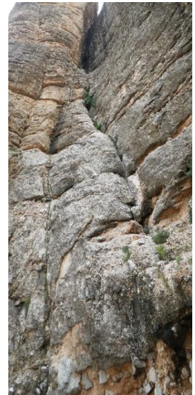
Pie de vía

Salimos de Horta de Sant Joan hacia el sur por la T-334. En el primer desvío tomaremos la dirección a Arnes. Al cabo de unos pocos metros ya veremos una indicación hacia la izquierda de Els Ports que es por donde entraremos al parque. A unos 4,8km de tomar este desvío encontraremos una zona para aparcar el coche con la indicación de Roques de Sant Benet. Nos desviamos y continuamos por una pista no asfaltada unos 1.6km hasta una bifurcación donde, en el ramal de la izquierda, hay una barrera. Dejamos el coche en este punto y seguimos andando hacia la barrera.