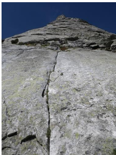
Pie de vía

Desde la distancia, lo que se ve es una plancha en la base de un pico puntiagudo. En dicha placa tenemos una fisura que la recorre entera con un primer parabolts alto, es donde se inicia la vía Blues.