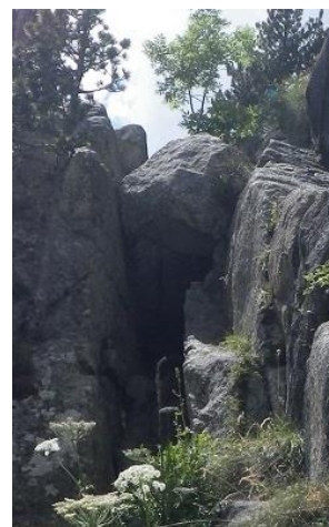
Paso del Oso

El único paso a destacar es el 'Paso del Oso' donde tendremos que trepar por una chimenea que tiene una piedra encastrada. Al cabo de unos 45 minutos de ascensión tendríamos que estar sobre un mar de piedras grandes y ver Comalestorres. Nuestra aguja, la 4ª, está con tendencia hacia la derecha. Seguiremos los hitos que nos llevarán hasta pie de pared.