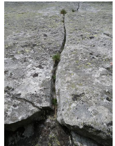
Fisura de inicio de La Pistacho Asesino

Para encontrar el pie de vía tenemos que fijarnos en la fisura que acaba a media placa con parabolts a su derecha. Hay una vía a su izquierda con parabolts pero está totalmente sobre placa y a su derecha está la vía Blues que también tiene parabolts pero la fisura es bastante más larga