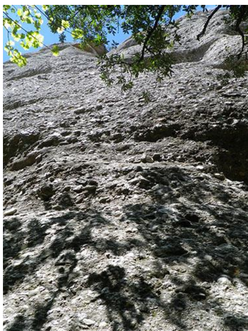
Vista desde pie de vía

Desde el Hotel El Bruc tomar la BP-1101 dirección norte. Unos metros antes de cruzar con la BP-1103, a mano derecha encontramos el parking de Can Maçana. Desde ahí caminar siguiendo las indicaciones de Agulles o Refugi de Vicenç Barbé. Tendremos que pasar por el Pas de la Portella que nos llevará a la región de Agulles, seguiremos y bajaremos por un sendero dirección refugio. Justo antes de la subida para llegar al refugio y un poco antes de cruzar la canal del Cirerer, por nuestra izquierda surge una senda poco marcada que asciende a un colladito entre la Miranda de les Boïgues y Les Momietes. En el collado veremos la zona más pisada donde se encuentra el inicio de vía. La primera chapa está a unos 6 metros de altura.