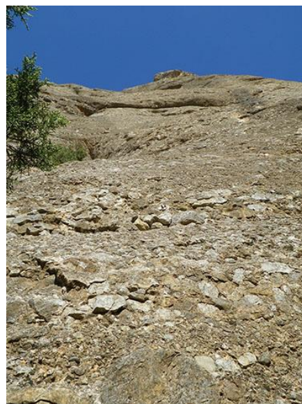
Foto desde pie de vía

río, estaremos viendo la pared. Deberíamos poder cruzar el río algo antes de la pared. A partir de aquí es bastante evidente llegar a la pared. Hemos de guiarnos por la mancha más anaranjada y con desplome de la pared, a cuya derecha hay una fisura con un árbol. Nuestra vía empieza prácticamente debajo de la fisura. Tenemos que ver dos parabolts muy seguidos.