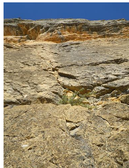
Pie de vía