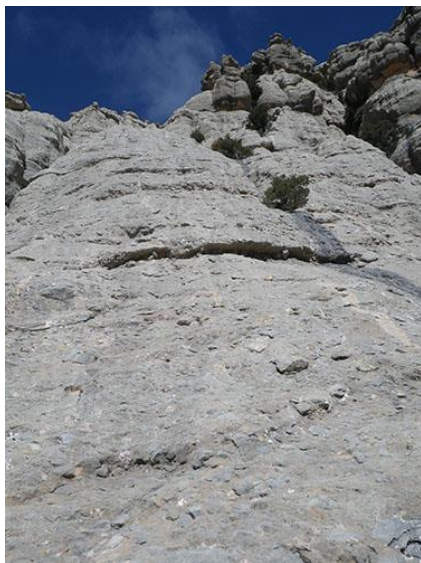
Foto desde pie de vía

Ermita de Fabana respectivamente; será la dirección que hemos de tomar. En la bajada, tendremos una curva hacia la derecha donde nos encontraremos con un hito, a partir de aquí habrá que intentar seguir los hitos. Daremos algo de vuelta y en algún momento habrá que subir algún resalte. Para intentar situarnos, tenemos que fijarnos en la parte anaranjada de la roca en sentido horizontal. Hay 2 'columnas' que tienen únicamente en la parte superior la zona anaranjada muy marcada. La que nos interesa a nosotros es la que está más a la izquierda. En alguna reseña hemos leído que a pie de vía tiene que haber un hito, nosotros no lo vimos, sólo vimos piedras que podían ser unos restos de un hito.