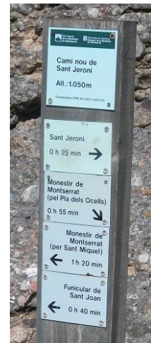
Indicación Camí nou de Sant Jeroni

tendremos un sendero ligeramente marcado a nuestra derecha. Es por el cual tenemos que bajar. A partir de aquí es una jabinada y habrá que bajar por donde veamos que podemos pasar. La pared que nos interesa la tendremos a nuestra derecha, iremos por intuición hasta pie de pared, guiándonos por los agujeros tan marcados que tiene esta aguja. La vía empieza justo en la arista, donde hay situada una encina con varios cordinos. Nuestro primer parabolt está en la vertical de la encina.