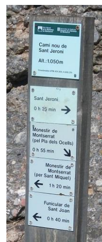
Indicación Camí nou de Sant Jeroni

tendremos un sendero ligeramente marcado a nuestra derecha. Es por el cual tenemos que bajar. A partir de aquí es una jabinada y habrá que bajar por donde veamos que podemos pasar. La pared que nos interesa la tendremos a nuestra derecha, iremos por intuición hasta pie de pared, guiándonos por los agujeros tan marcados que tiene esta aguja. La vía empieza justo en la arista, donde hay situada una encina con varios cordinos. Nuestro primer parabolt está en la vertical de la encina.