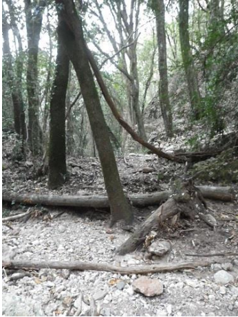
Punto donde tendremos que abandonar el torrente

Una vez en el torrente, en algo menos de 10 minutos deberíamos haber encontrado un camino poco marcado a nuestra izquierda. Nos llevará por una canal algo guarra hasta pie de vía. Ojo que el pie de vía no está a pie del 'plec' donde se encuentra la aresta Arcarons. El pie de vía está entre el 'plec' de la aresta Arcarons y el 'plec' de su izquierda. Tendremos una zona plana donde desplegar las cuerdas y donde podemos dejar alguna mochila ya que de bajada pasaremos por aquí de nuevo.