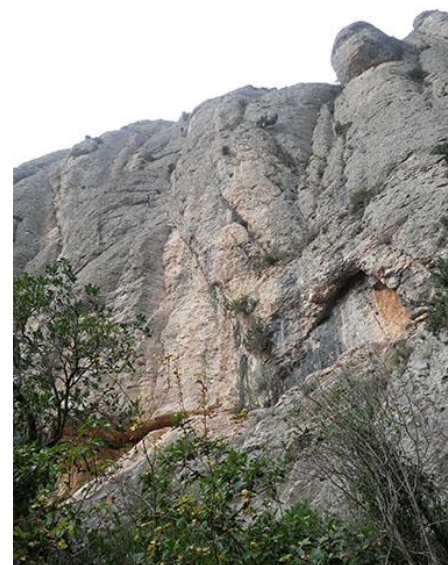
Vista cerca de pie de vía con la roca que sobresale como referencia

encontremos dos senderos, uno que sube y otro con postes de madera. Tenemos que tomar éste segundo sendero. En las bifurcaciones tenemos que seguir la flecha o el punto verde y meternos en la canal de l'Artiga Alta. En caso de duda seguir el camino de la izquierda y en ningún momento seguir el cartel de la vía ferrata. Al cabo de unos 25 minutos de haber tomado el sendero