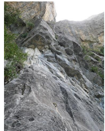
Pie de vía