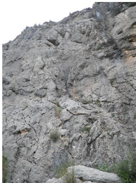
Inicio de la Miquel Xirimita

ferrata. Descender y al cabo de unos 40 metros nos desviamos hacia la izquierda para metemos por el barranco; lo reseguimos hasta lo que parece el final, cuando el camino deja de ser ancho. Nos metemos entre los arbustos por el lado derecho siguiendo la misma dirección y nos llevará hacia un sendero que asciende hacia el Ponoig. Como la subida se acaba bifurcando varias veces hay que buscar algo característico en la pared al subir y guiarnos por ello. Buscamos una zona de roca gris más sostenida donde hay varias vías. No hay ninguna marca especial de inicio para la Miquel Xirimita. La vía inmediatamente a la izquierda es la Café-Licor que sí está marcada con las siglas CL pero cuyo inicio es algo más duro que la Miquel Xirimita.