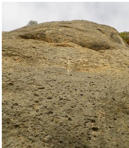
Pie de vía

cartel del Parque Natural aparcamos. Desde ahí sale un camino hacia el norte que nos llevará a unas viñas. En ese tramo nos encontraremos un desvío a mano derecha marcado con un hito. Seguimos el desvío hasta llegar al GR donde iremos hacia la izquierda. En la siguiente bifurcación, donde hay un cartel informativo de vía ferrata, tirar por el camino de la izquierda. Desde aquí nos quedarán unos 25 minutos para llegar hasta la pared por un camino marcado. Diez metros antes de llegar a la pared, tirar hacia la derecha, estaremos prácticamente a pie de vía.