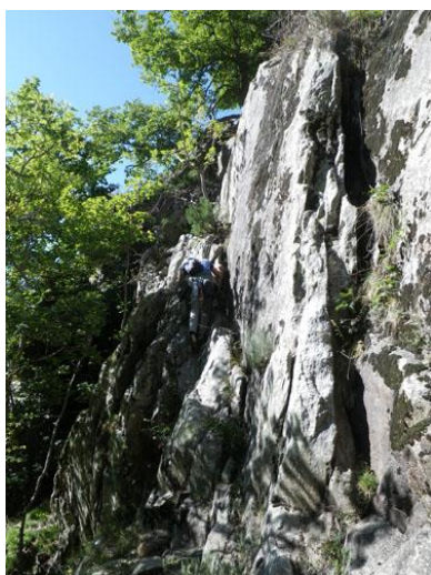
Trepada de II grado para llegar a la repisa con la R0

ver un desvío amplio a nuestra derecha con un cartel indicando 'Col de Jou'. Unos 100 metros más adelante, a nuestra derecha deberíamos ver otros carteles uno de ellos indicando 'Cabane de Moura', dirección que hemos de tomar. A partir de aquí seguiremos una media hora un camino bien definido hasta llegar a un puente de hierro. Antes de cruzar nos iremos hacia la izquierda y buscamos un camino poco definido, paralelo al cauce del río y que tiene algún hito. Éste nos llevará hasta un punto donde se podrá cruzar el río mojándonos los pies. Al otro lado volveremos a tener hitos que nos dirigirán hasta la pared. La primera pared a la que nos llevará es una que tiene parabolts y que, mirando a nuestra izquierda, veamos otra que se inicia más abajo. Nos interesa irnos a esta que vemos. Una vez en la pared inferior, la reseguiamos hasta el final donde encontraremos una trepada de II grado para ascender a una repisa. Ahí a la derecha encontraremos la R0