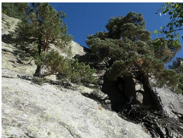
La pared desde pie de vía

cual ascender. Al final nos llevará a un camino hasta encontrarnos con un hito grande que en la base tiene pintado un punto rojo. Es el lugar donde nos tenemos que dirigir hacia la pared que nos queda cerca y buscar una cuerda fija que nos ayudará a treparla. Una vez arriba, seguimos hacia la derecha por un camino marcado hasta volver a encontrar un hito grande. Aquí nos volvemos a dirigir hacia la pared y buscamos los hitos que nos marcan por dónde ascender. Una vez estemos