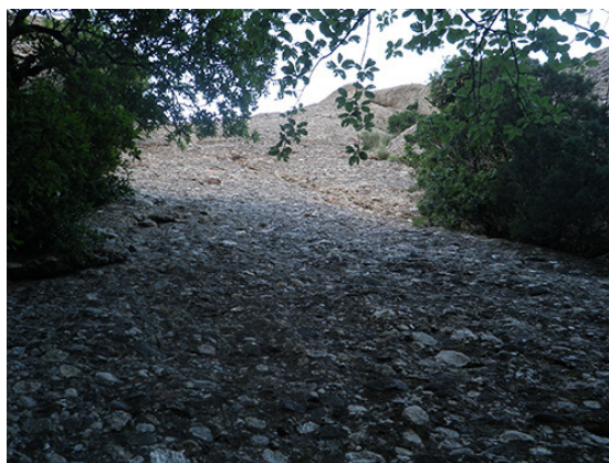
Foto desde pie de vía

llegar a un collado. Al cabo de unos 7 minutos de descenso desde dicho collado, el camino se bifurca. Tomamos el camino de la izquierda (tendríamos que ver un poste redondo a nuestra izquierda, junto a la pared, donde no se distingue el texto). Seguiremos unas marcas amarillas hasta unos 80 metros antes de la Agulla de la Pilota donde nos meteremos a mano izquierda por una torrentera. La reseguimos hasta que veamos la base de la pared.