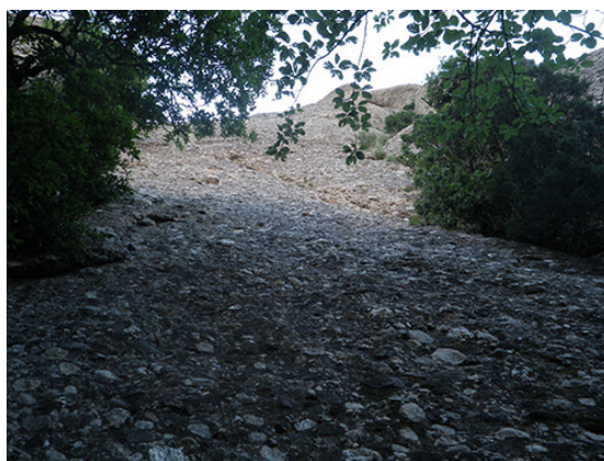
Foto desde pie de vía

llegar a un collado. Al cabo de unos 7 minutos de descenso desde dicho collado, el camino se bifurca. Tomamos el camino de la izquierda (tendríamos que ver un poste redondo a nuestra izquierda, junto a la pared, donde no se distingue el texto). Seguiremos unas marcas amarillas hasta unos 80 metros antes de la Agulla de la Pilota donde nos meteremos a mano izquierda por una torrentera. La reseguiremos hasta que veamos la base de la pared.