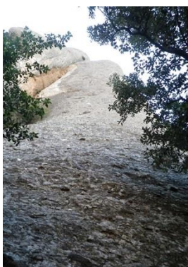
Pie de vía

Desde el aparcamiento salimos dirección norte – noroeste, cruzando las oliveras para ir a buscar el inicio de la torrentera. La reseguiamos y ascendemos hasta encontrarnos un desvío junto a una balsa cuadrada. Tomamos el desvío de la