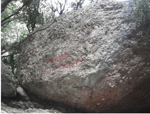
Bloque donde pone PARED MONTGROS

Una vez en el torrente, en algo unos de 15 minutos Llegaremos a una roca que tiene escrito en rojo PARED MONTGROS. Subimos por ahí para ir a buscar una cuerda fija, una vez superada seguiremos ascendiendo. Antes había una segunda cuerda fija, ahora sólo encontraremos restos de la cuerda atados a un árbol. En este punto seguiremos ascendiendo con tendencia a la derecha para ir a buscar el