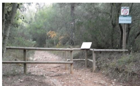
Barrera que veremos desde el coche